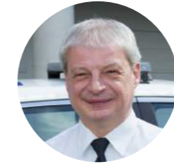
Prévention et éducation à la sécurité routière Inspecteur Principal Marc Pinte