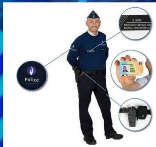
"Photo et conseils extraits de la Brochure "Le vol par ruse", www.besafe.be ".

Afin de ne pas être victime de ce genre de vol voici quelques conseils: